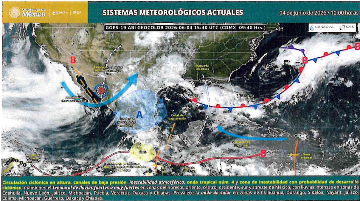
Fig. 1. Sistemas meteorológicos actuales.

Los sistemas meteorológicos mencionados ocasionarán los siguientes efectos: